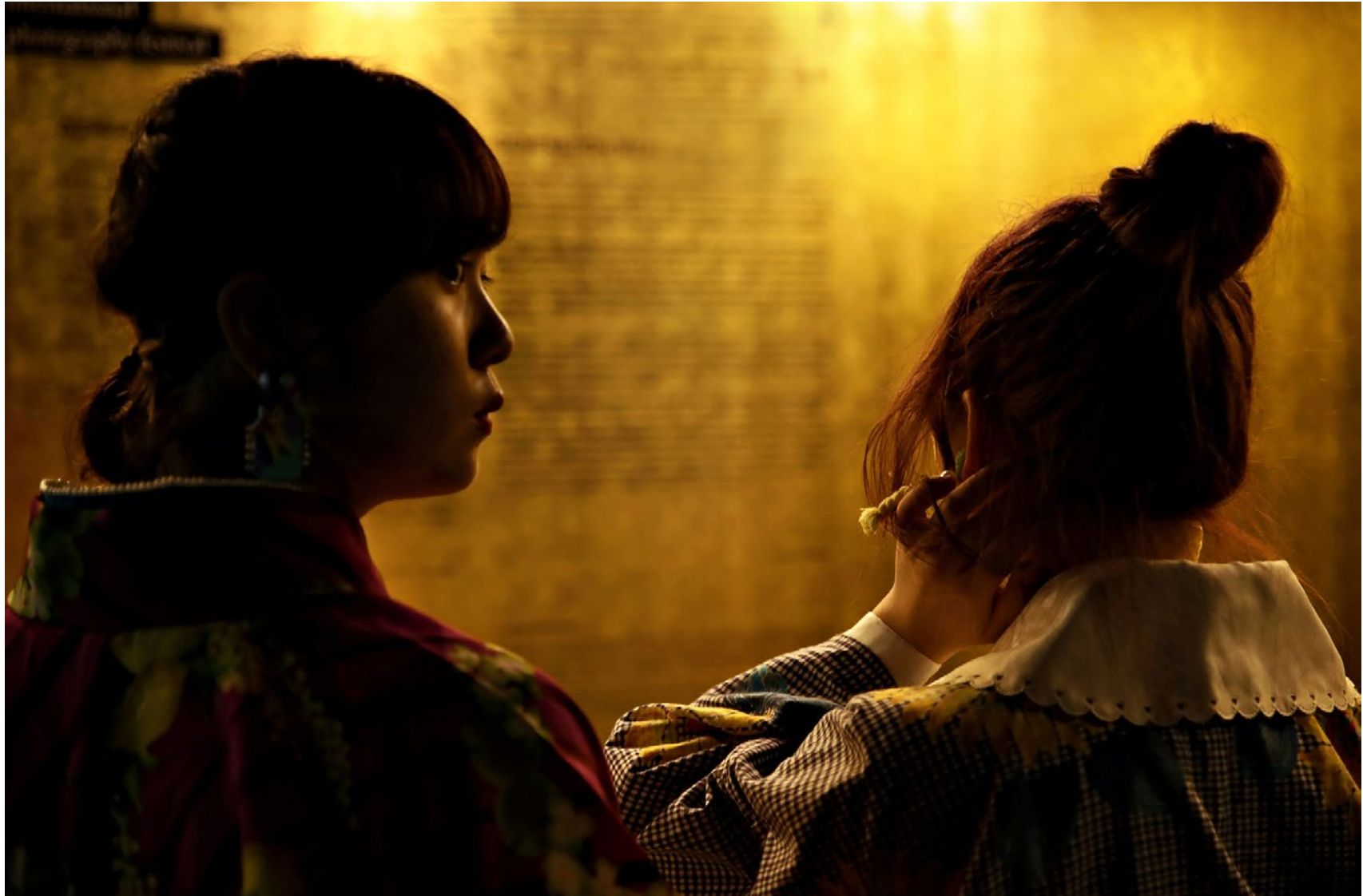
Série Les Marcheurs Attentifs #16 Impression Glicée sur papier Canson 100% Coton. Rag 310g Tirage: édition limitée de 7