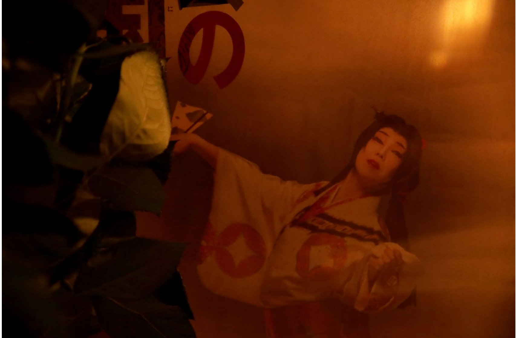
Série Les Marcheurs Attentifs #12 Impression Glicée sur papier Canson 100% Coton. Rag 310g Tirage: édition limitée de 7