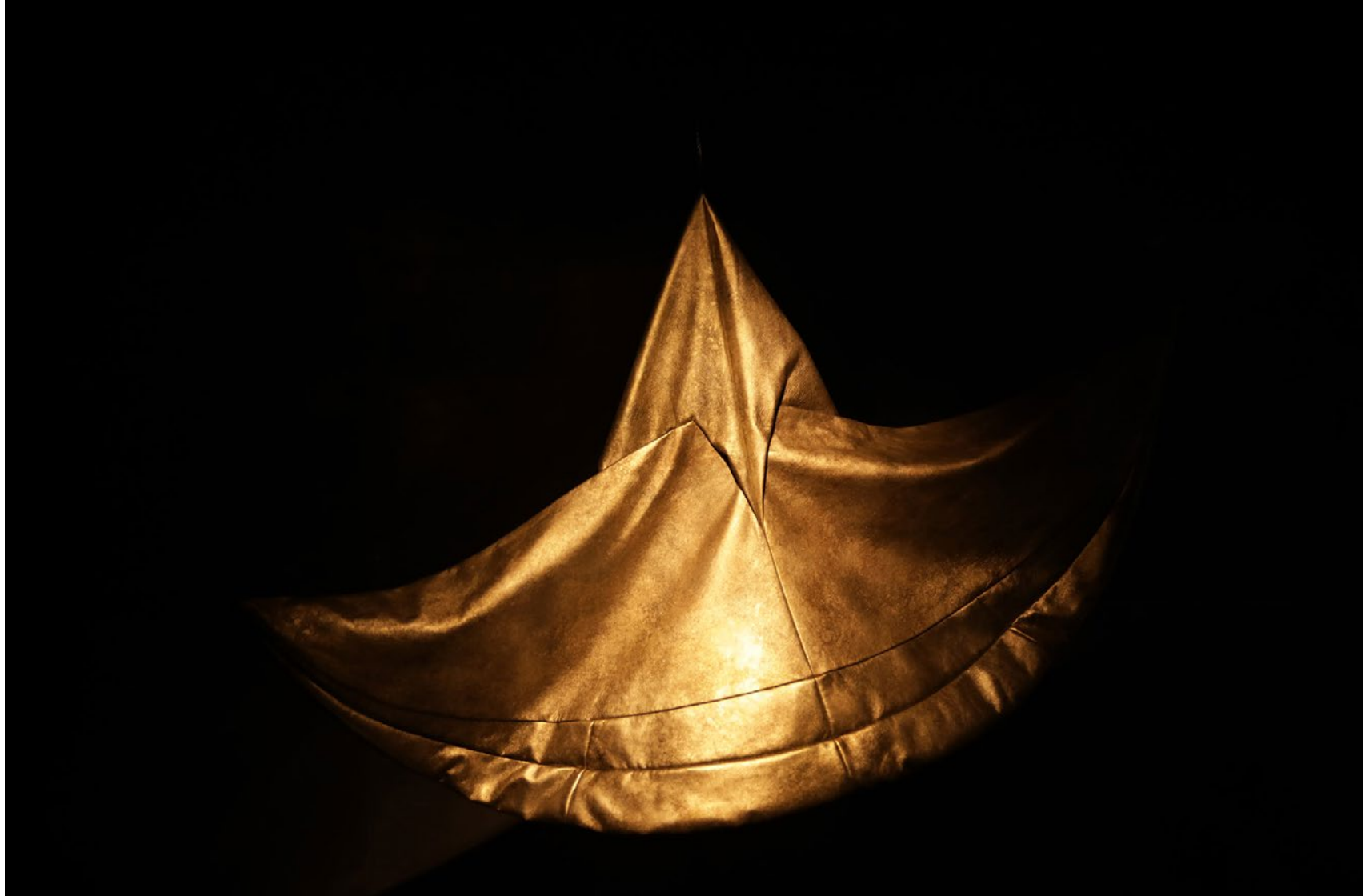
Série Les Marcheurs Attentifs #08 Impression Glicée sur papier Canson 100% Coton. Rag 310g Tirage: édition limitée de 7