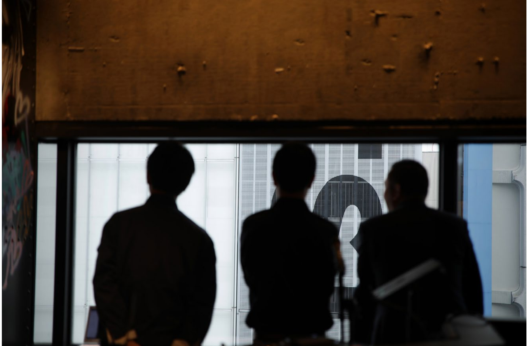
Série Les Marcheurs Attentifs #05 Impression Glicée sur papier Canson 100% Coton. Rag 310g Tirage: édition limitée de 7