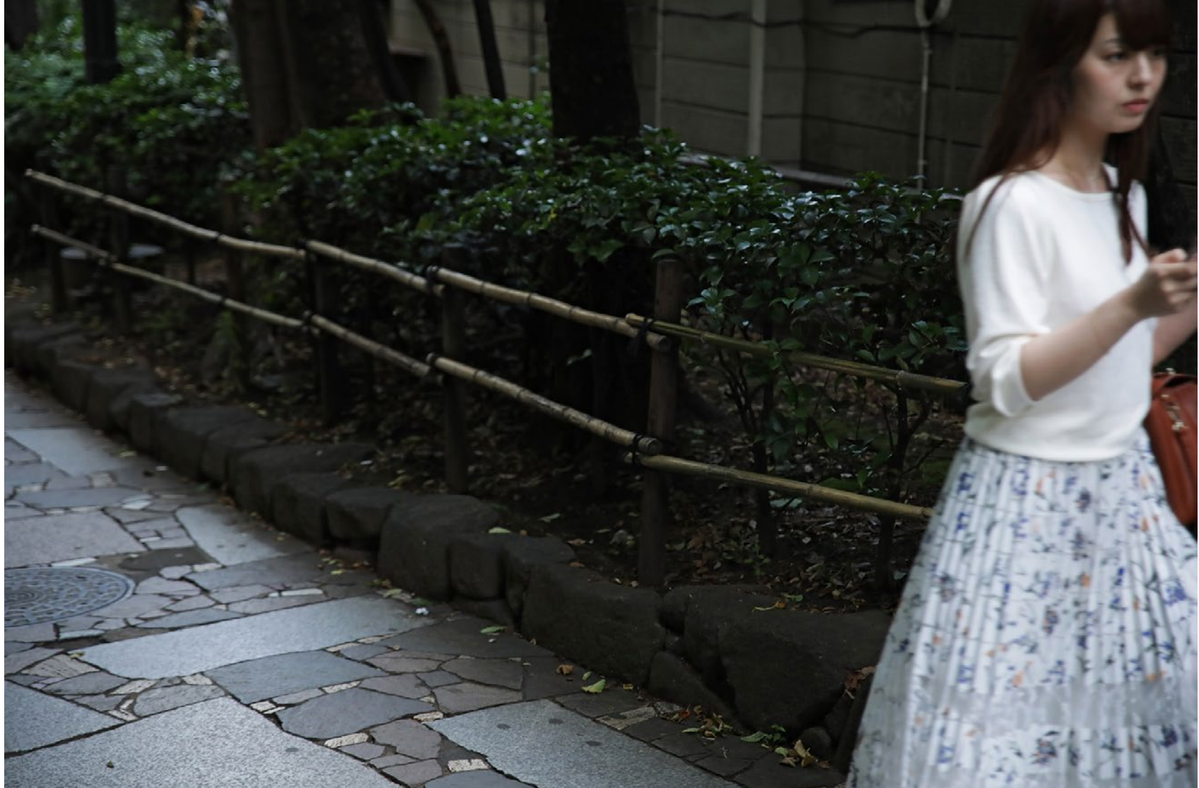
Série Les Marcheurs Attentifs #03 Impression Glicée sur papier Canson 100% Coton. Rag 310g Tirage: édition limitée de 7