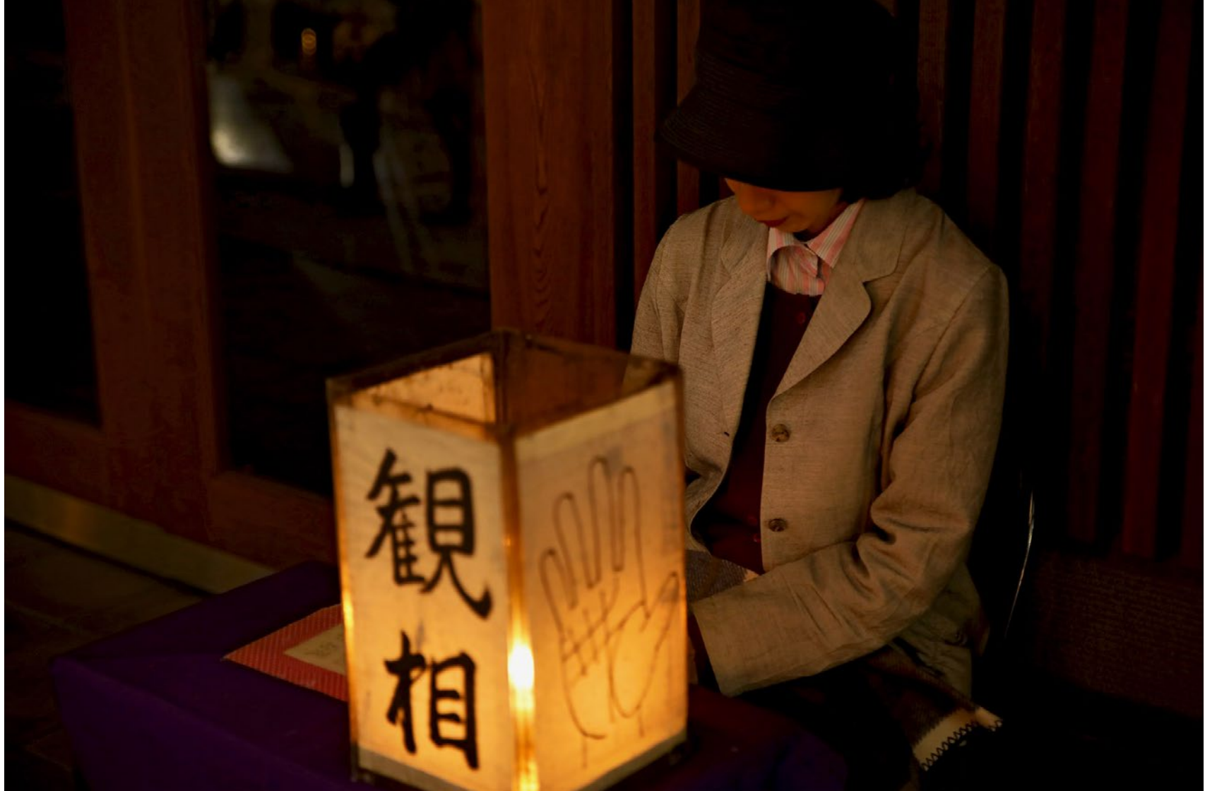
Série Les Marcheurs Attentifs #11 Impression Glicée sur papier Canson 100% Coton. Rag 310g Tirage: édition limitée de 7