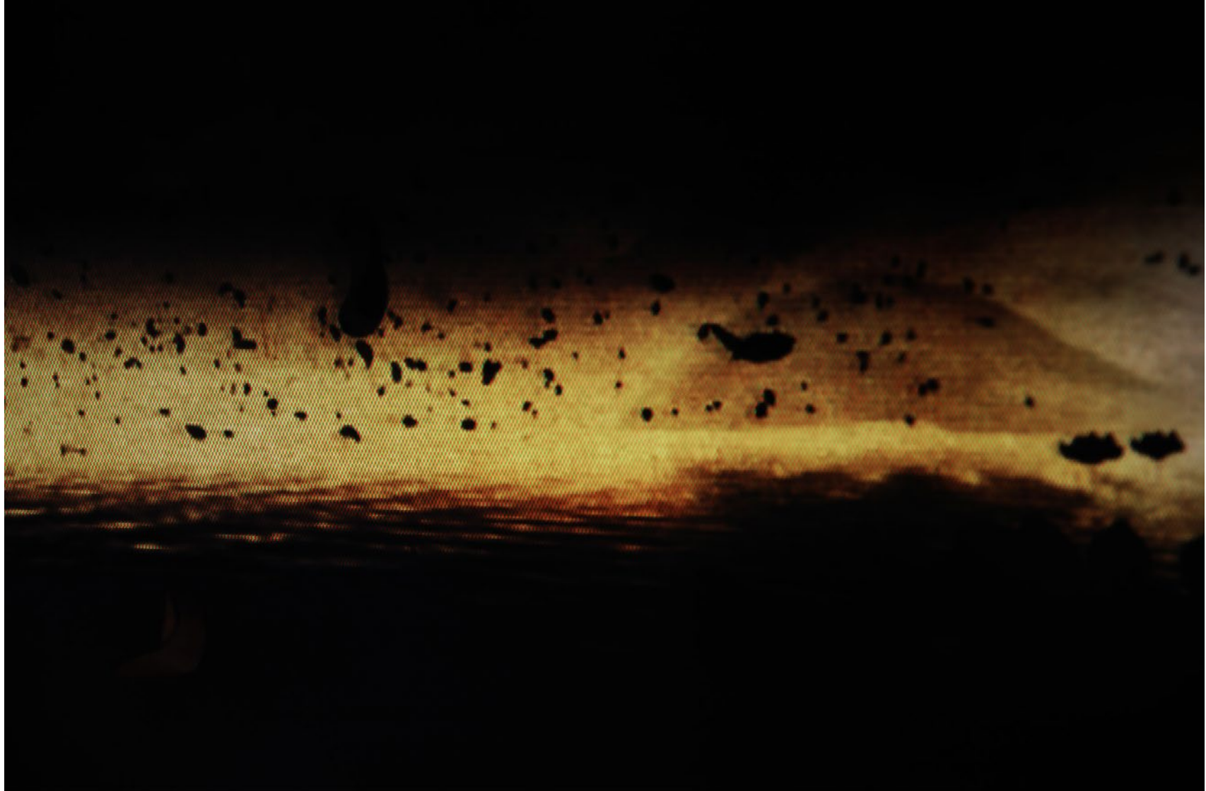
Série Les Marcheurs Attentifs #17 Impression Glicée sur papier Canson 100% Coton. Rag 310g Tirage: édition limitée de 7