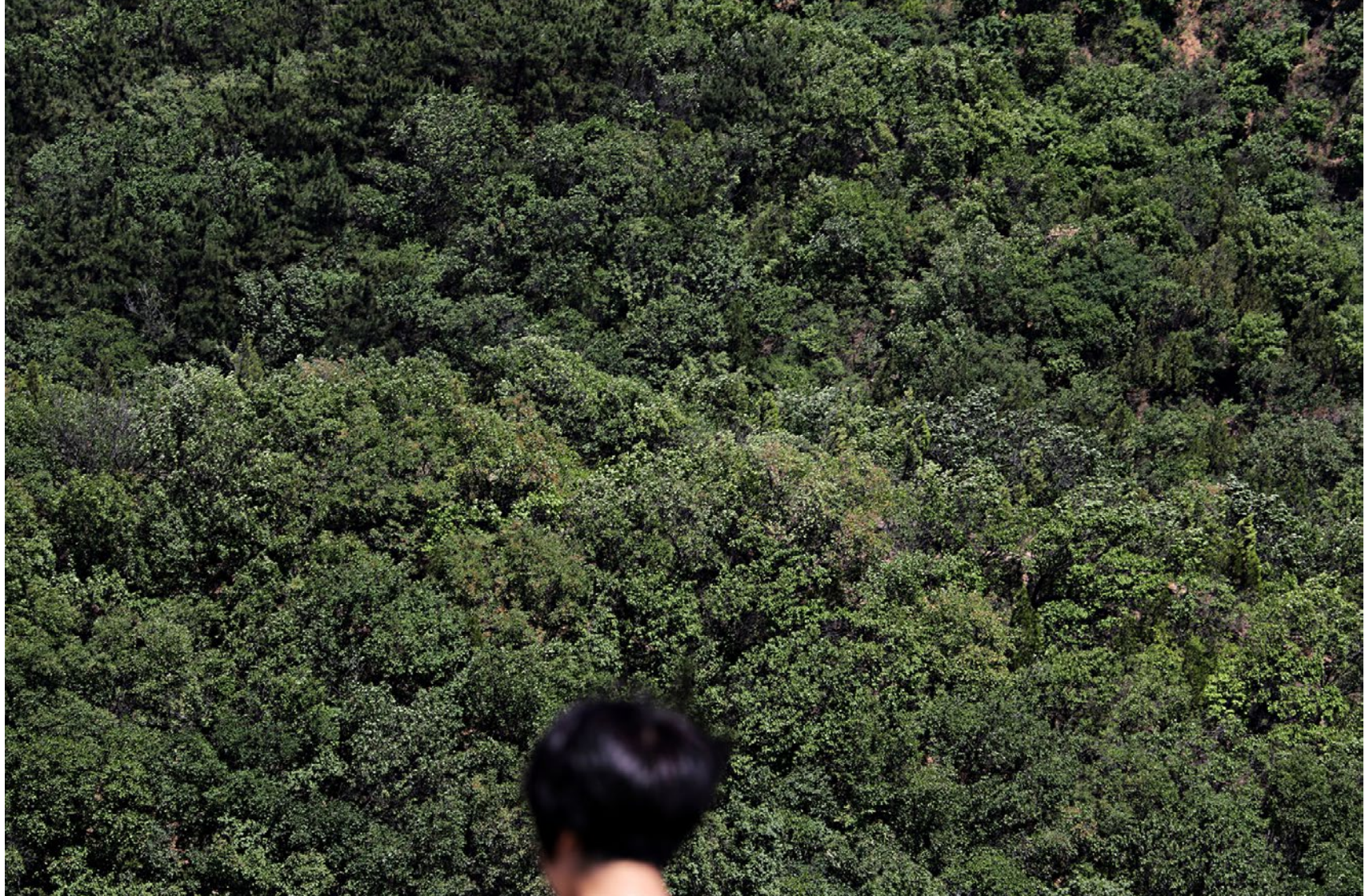
Série Les Marcheurs Attentifs #01 Impression Glicée sur papier Canson 100% Coton. Rag 310g Tirage: édition limitée de 7