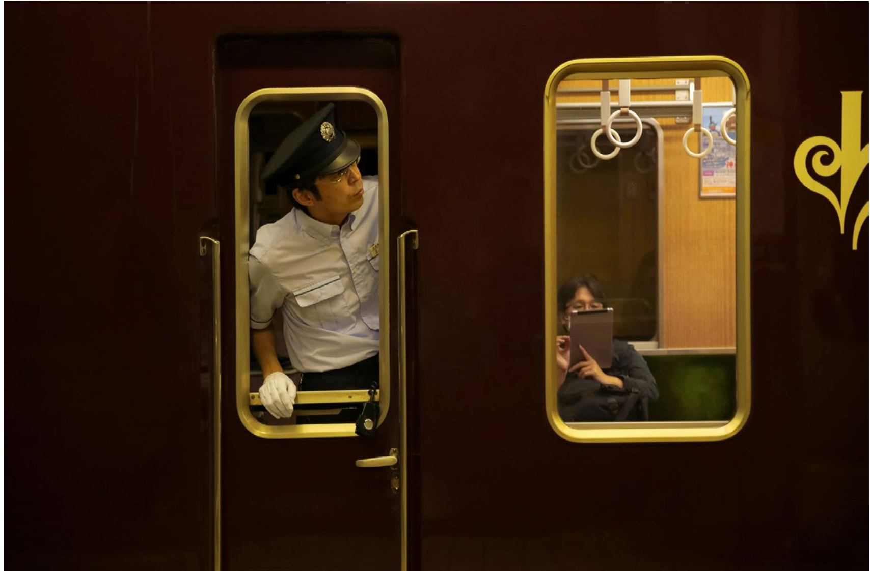
Série Les Marcheurs Attentifs #15 Impression Glicée sur papier Canson 100% Coton. Rag 310g Tirage: édition limitée de 7