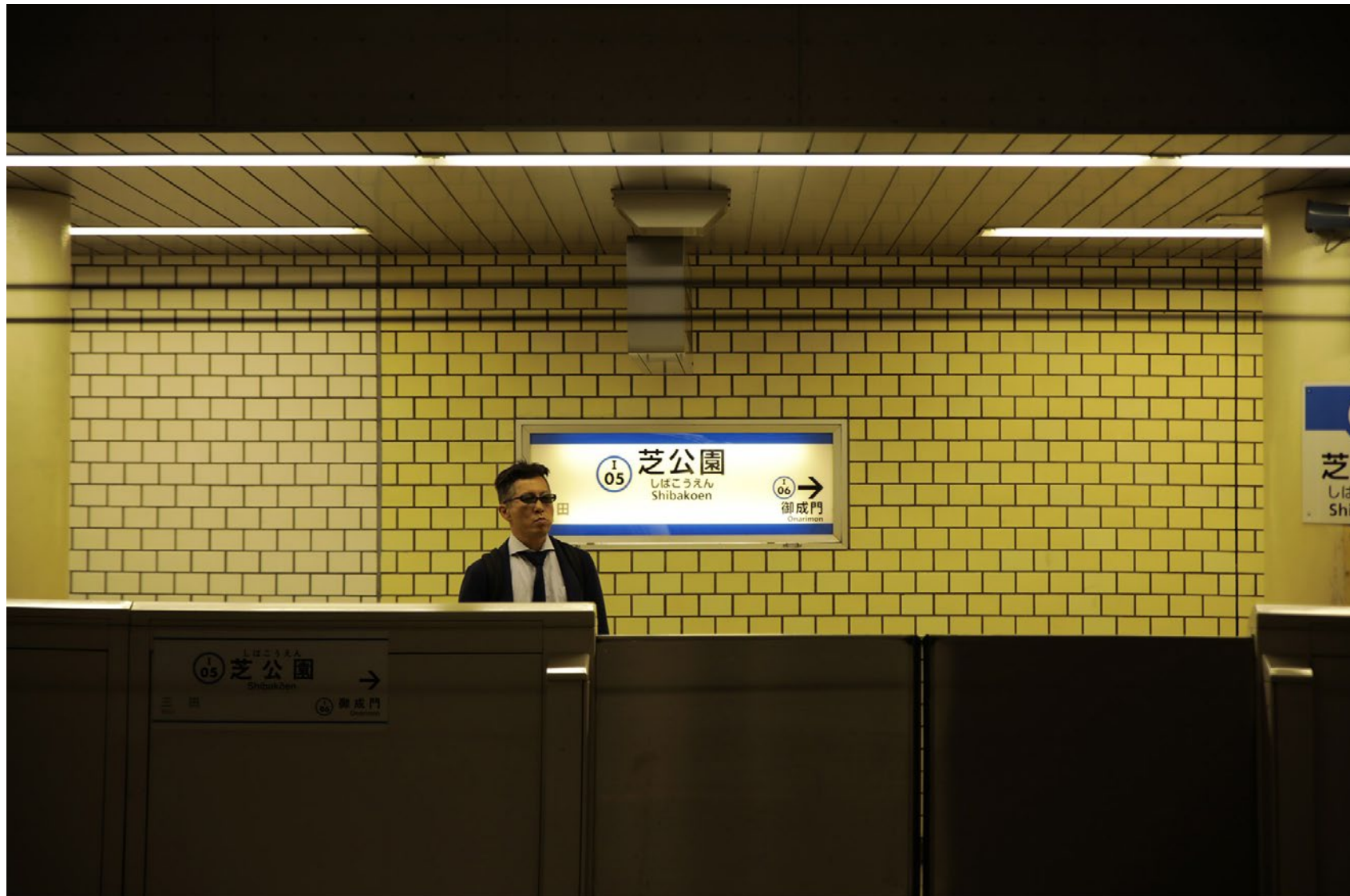
Série Les Marcheurs Attentifs #14 Impression Glicée sur papier Canson 100% Coton. Rag 310g Tirage: édition limitée de 7