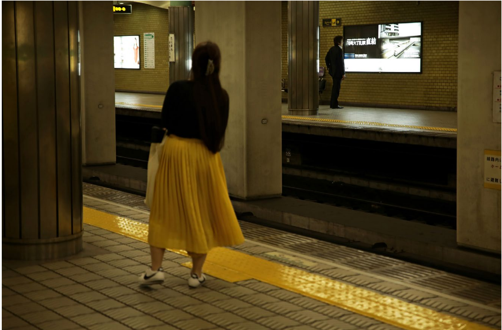
Série Les Marcheurs Attentifs #13 Impression Glicée sur papier Canson 100% Coton. Rag 310g Tirage: édition limitée de 7