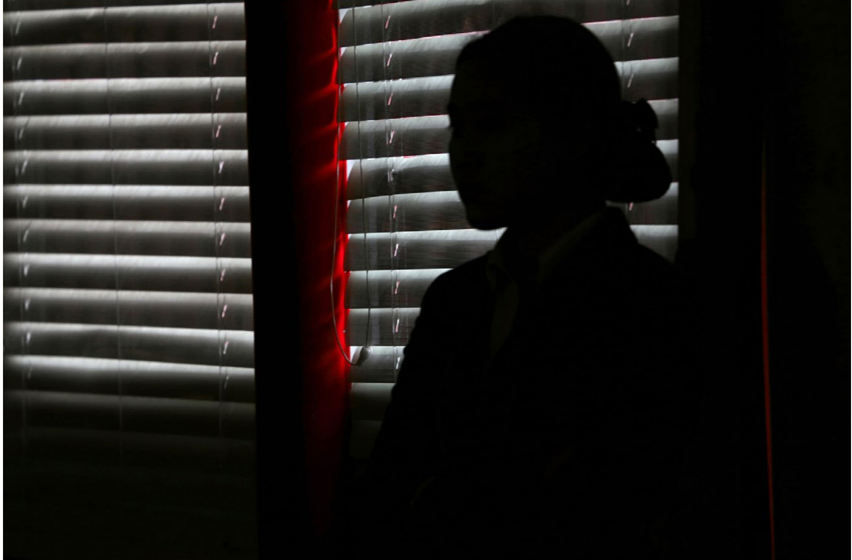
Série Les Marcheurs Attentifs #10 Impression Glicée sur papier Canson 100% Coton. Rag 310g Tirage: édition limitée de 7