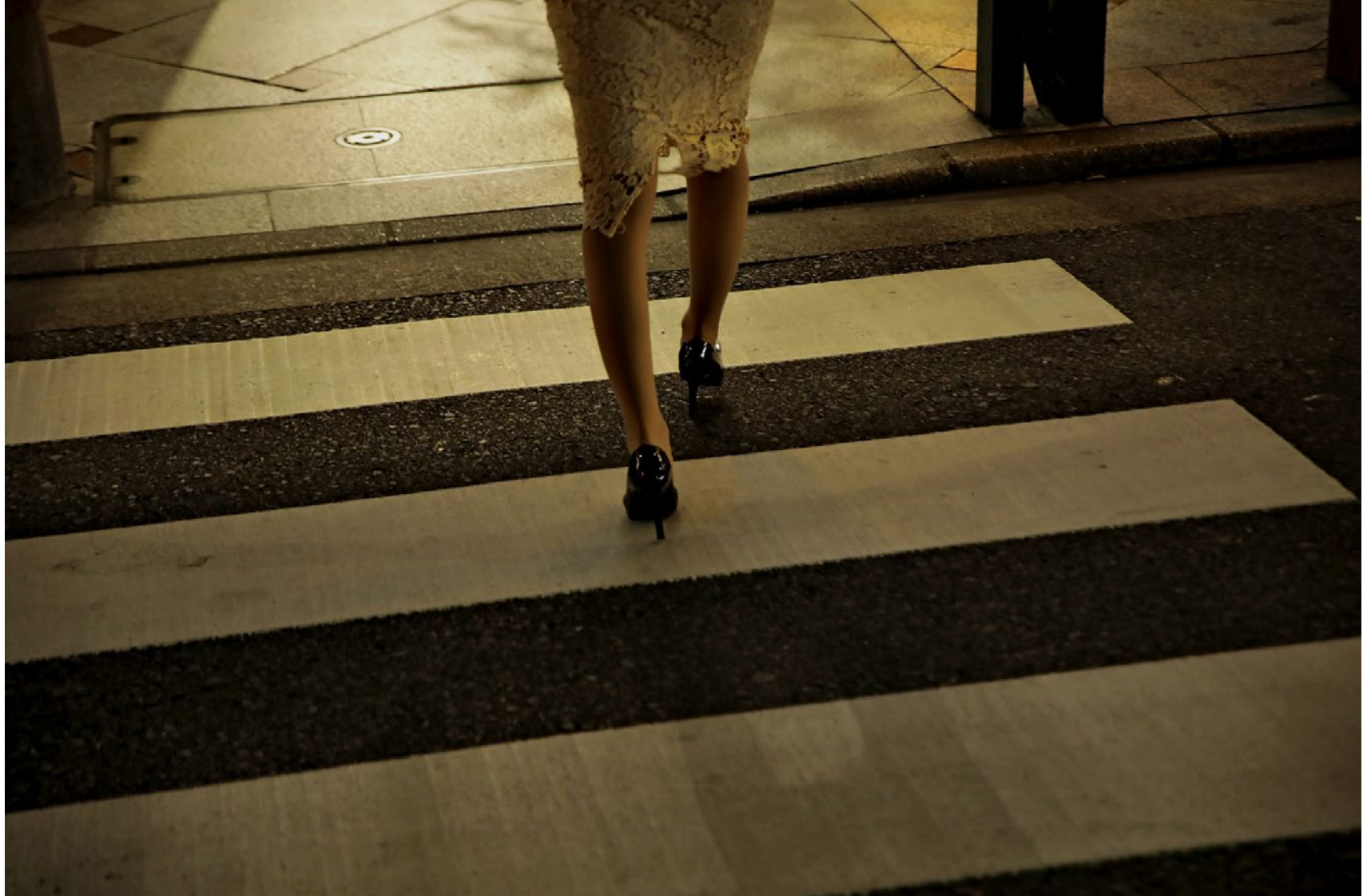
Série Les Marcheurs Attentifs #06 Impression Glicée sur papier Canson 100% Coton. Rag 310g Tirage: édition limitée de 7