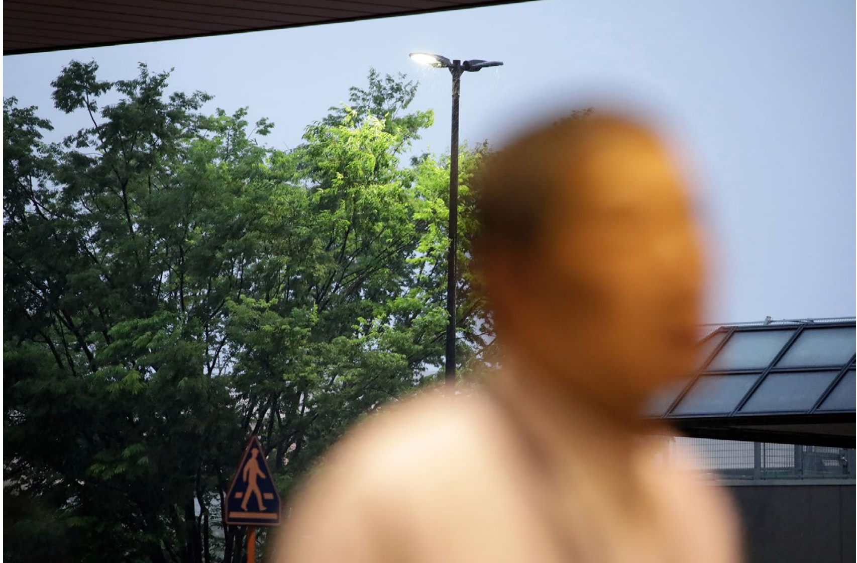
Série Les Marcheurs Attentifs #02 Impression Glicée sur papier Canson 100% Coton. Rag 310g Tirage: édition limitée de 7