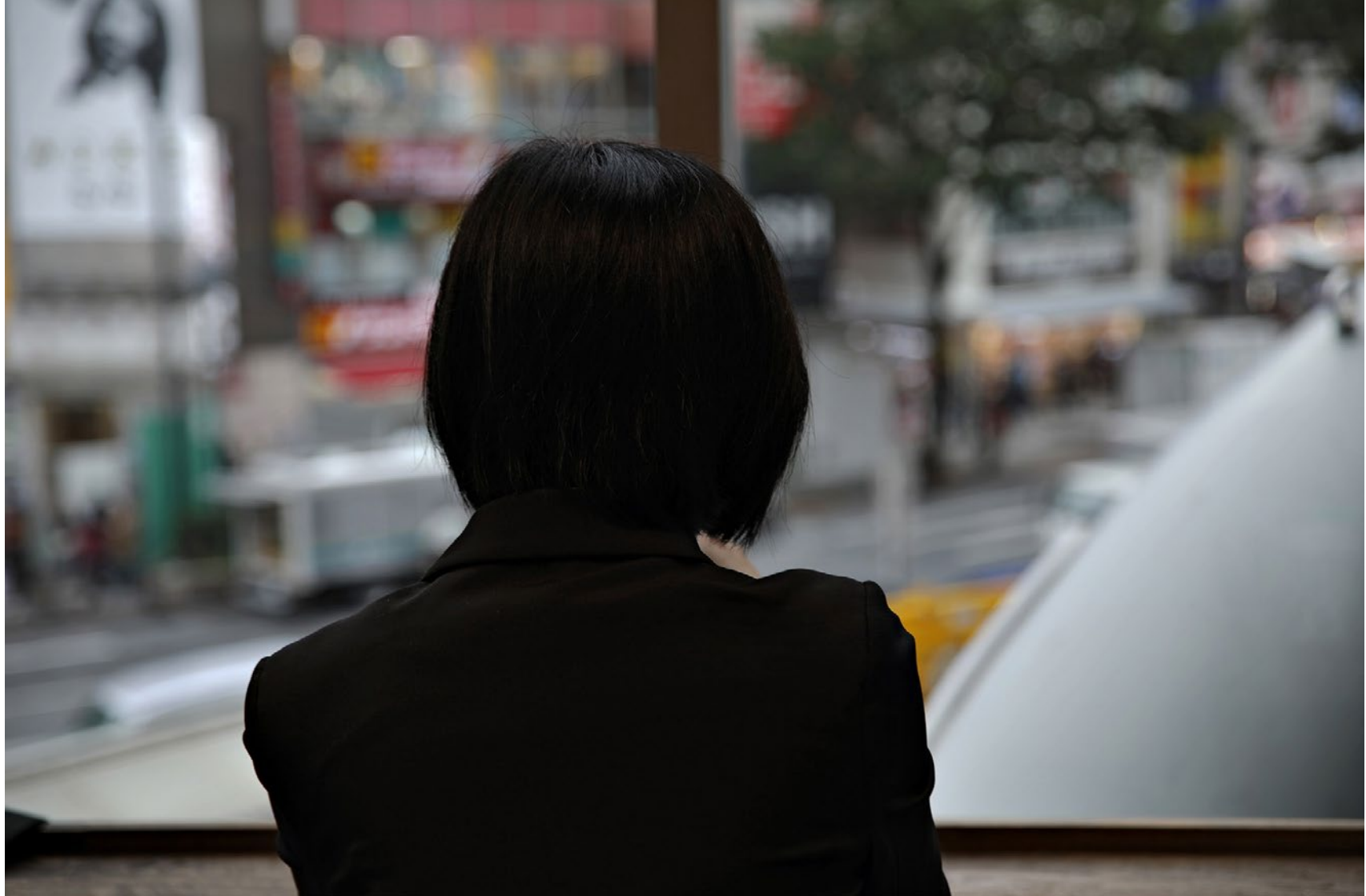
Série Les Marcheurs Attentifs #04 Impression Glicée sur papier Canson 100% Coton. Rag 310g Tirage: édition limitée de 7