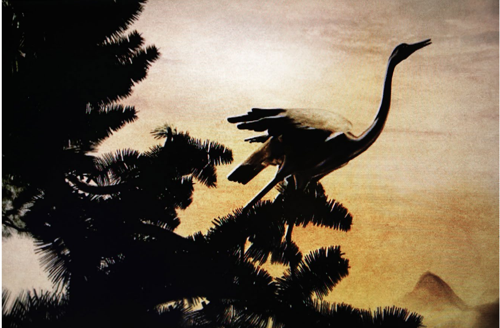
Série Les Marcheurs Attentifs #07 Impression Glicée sur papier Canson 100% Coton. Rag 310g Tirage: édition limitée de 7