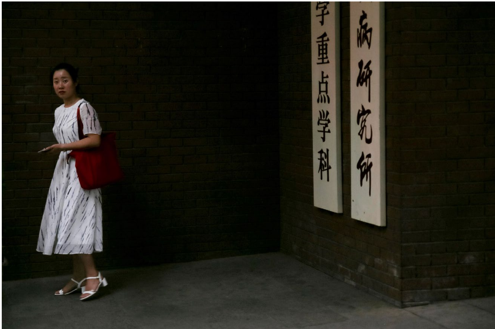
Série Les Marcheurs Attentifs #09 Impression Glicée sur papier Canson 100% Coton. Rag 310g Tirage: édition limitée de 7